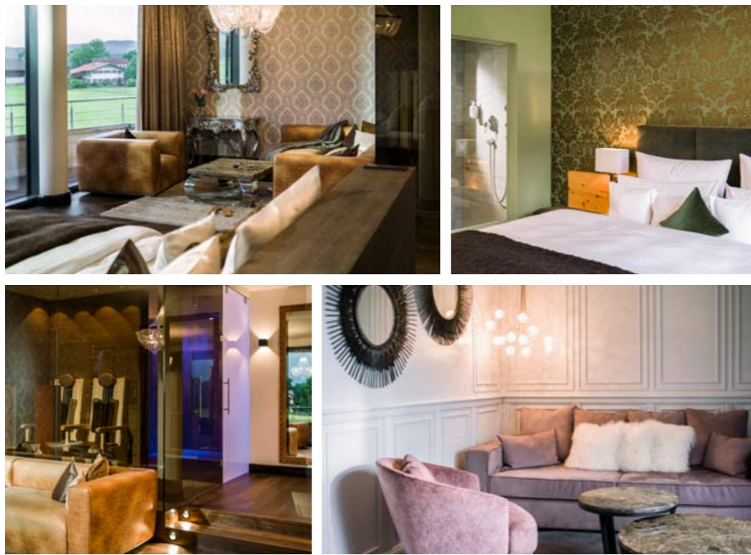
Urban, alpin oder elegant: Suiten, so vielfältig und individuell wie unsere Gäste.