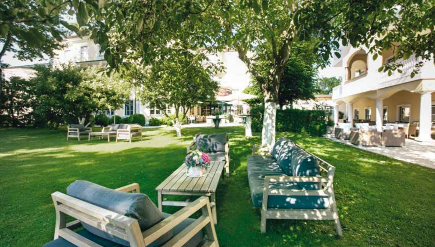
Es gibt Orte, an denen man deutlich spürt „Hier geht es mir GUT“. Manchmal erkennt man nicht sofort warum, denn die Liebe steckt oft im Detail.