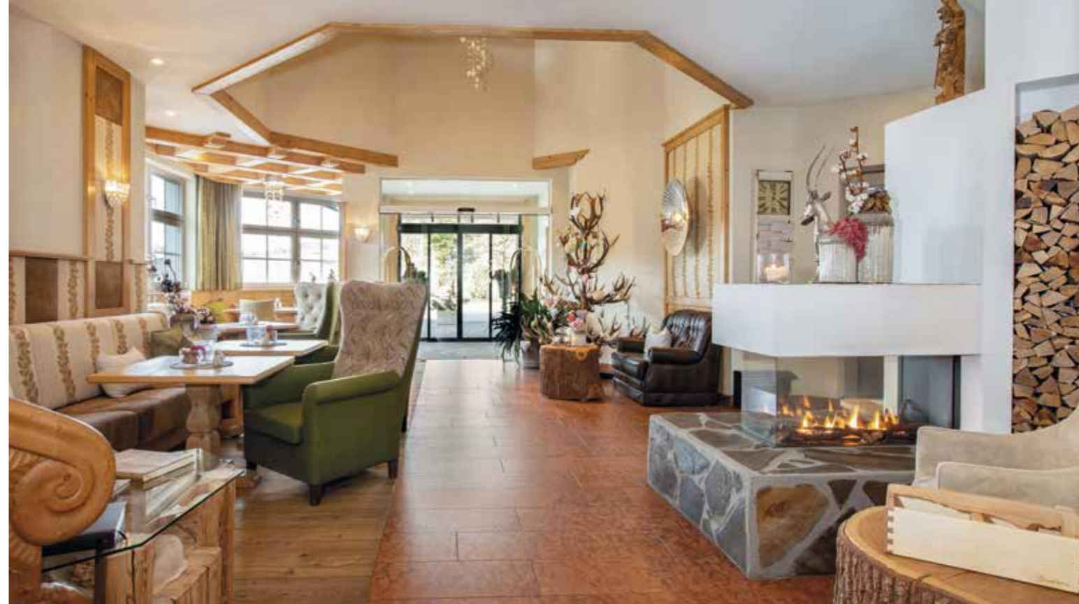
Es sind die ausgewählten, persönlichen und kleinen Herzlichkeiten, die aus einem Platz einen GUTEN machen.