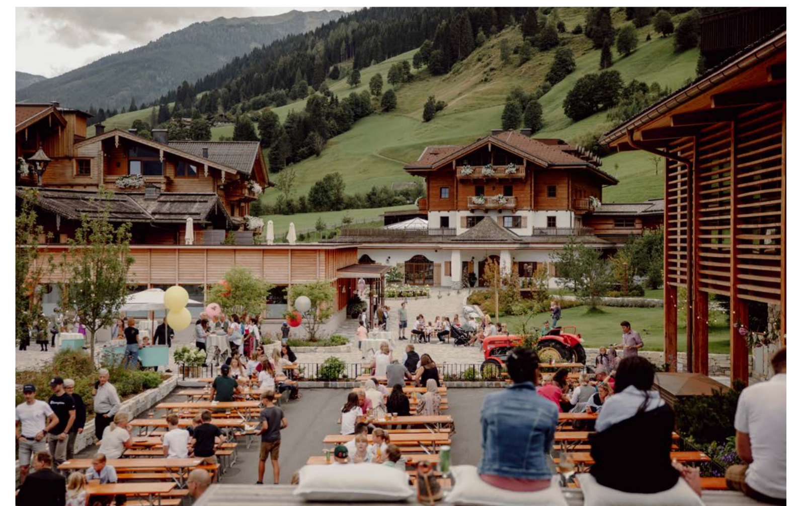
Bestes Wetter, ausgelassene Stimmung und kulinarische Highlights beim Familien-Sommerfest