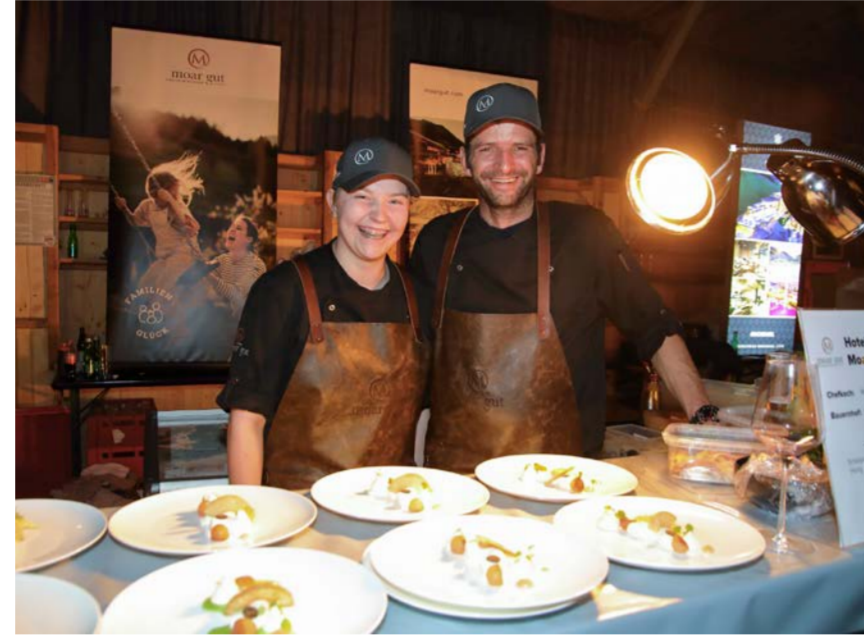
Bilder Wein & Genuss Gala: © www.grossartal.info