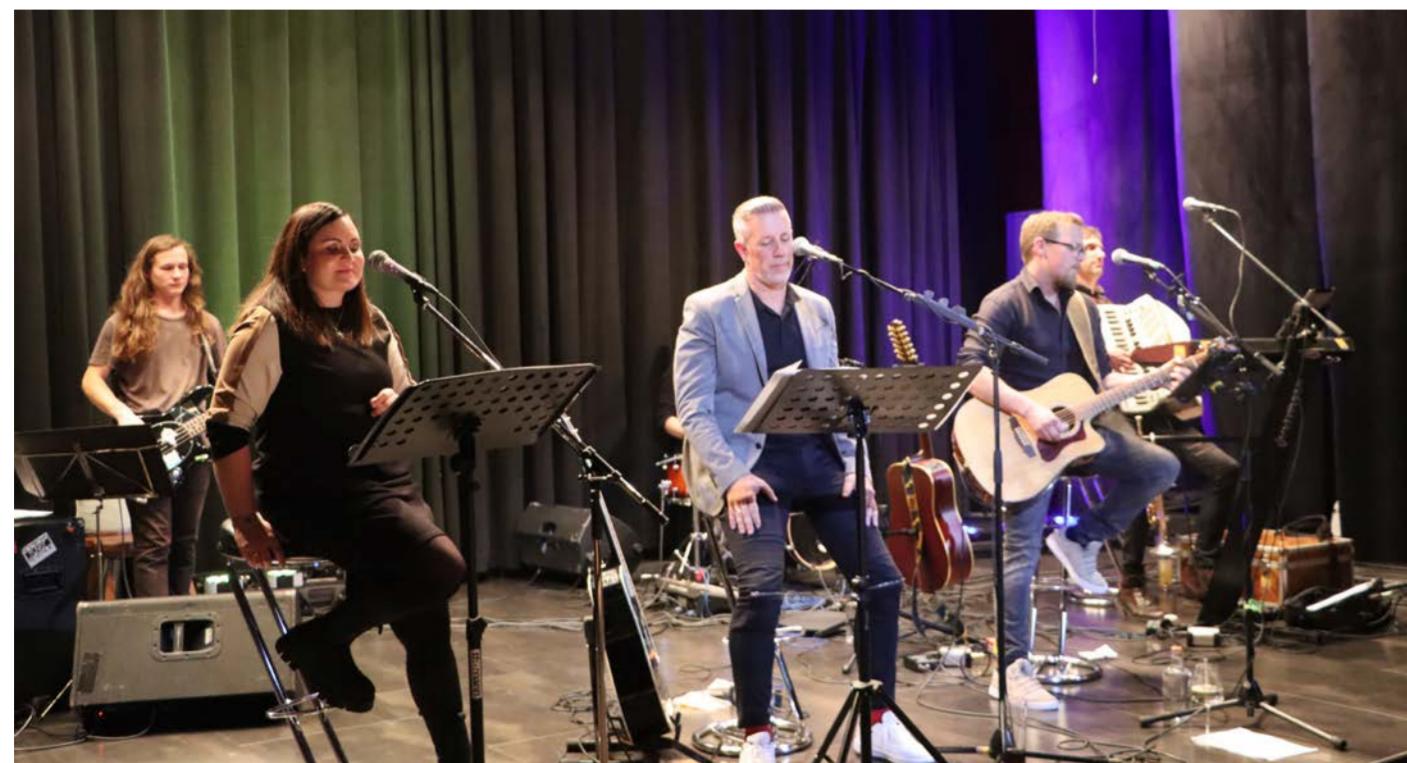
Johann's Erben standen auch beim letzten Charity Event auf der Moar Gut Bühne und sorgten für stimmungsvolle, vorweihnachtliche Stimmung.